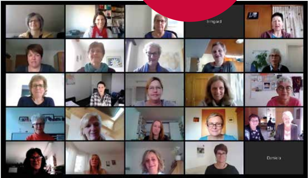
Begegnung im virtuellen Rechteck: Die Herbstkonferenz 2020